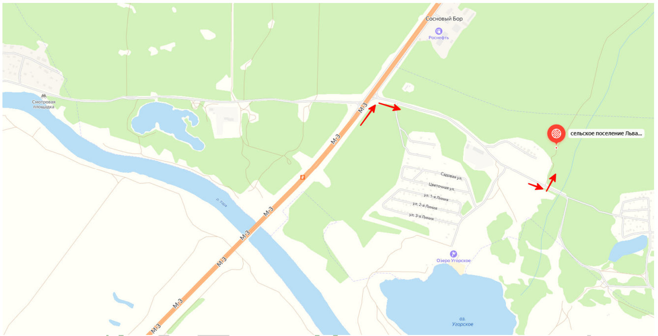
Рис.1 Рекомендации по заезду во 2 день соревнований (03.11.24)